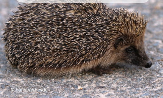
Hérisson d'Europe - Quasi menacé