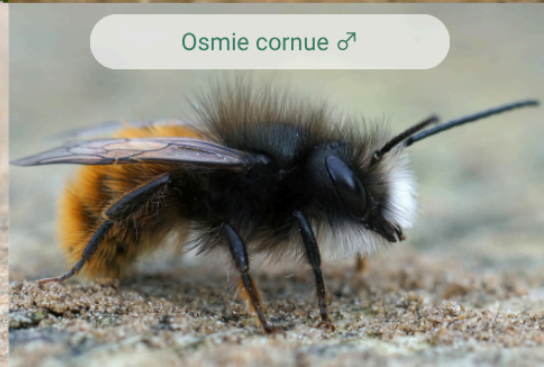
Osmie cornue ♂