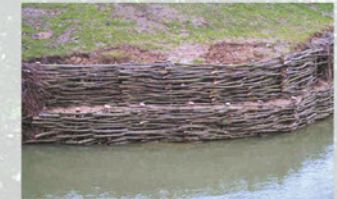
Fixation de berges