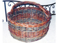
Panier en saule coloré