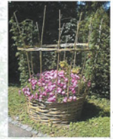
Support pour plantes grimpantes