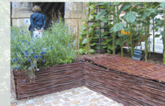
Plessis jardin médiéval