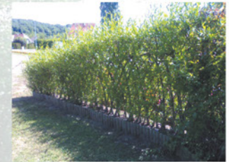
Clôture en osier vivant

Récemment, le Parc naturel du Pays des Collines a lancé une opération intitulée : « Un saule taillé, un saule planté » visant à sensibiliser les particuliers au rôle du saule têtard ainsi qu'à son maintien et son entretien.