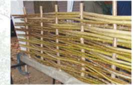
Plessis en fabrication