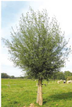
Année N + 5