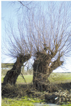
Année N + 20